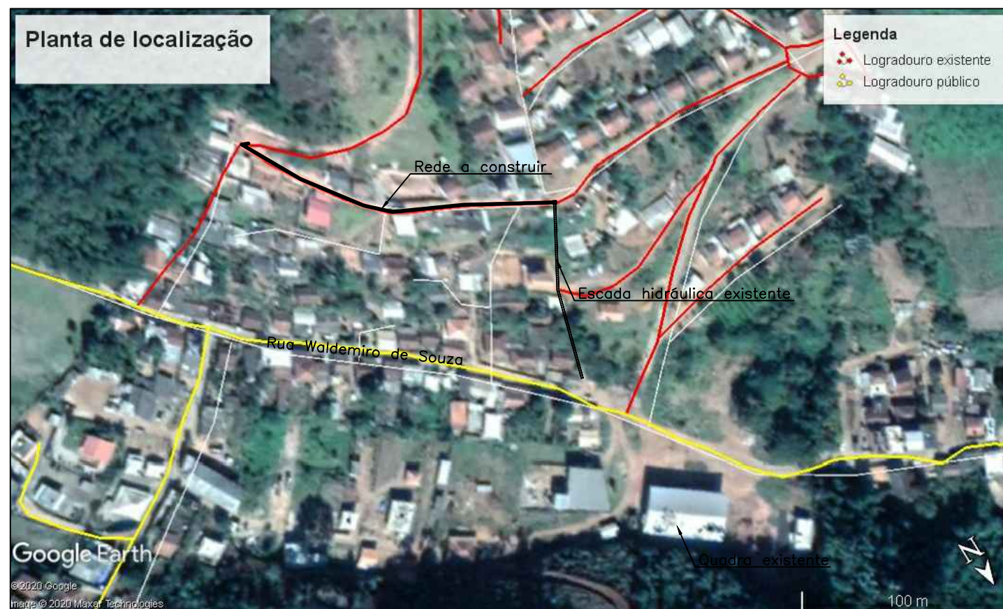
3 PLANTA DE LOCALIZAÇÃO esc 1:2500