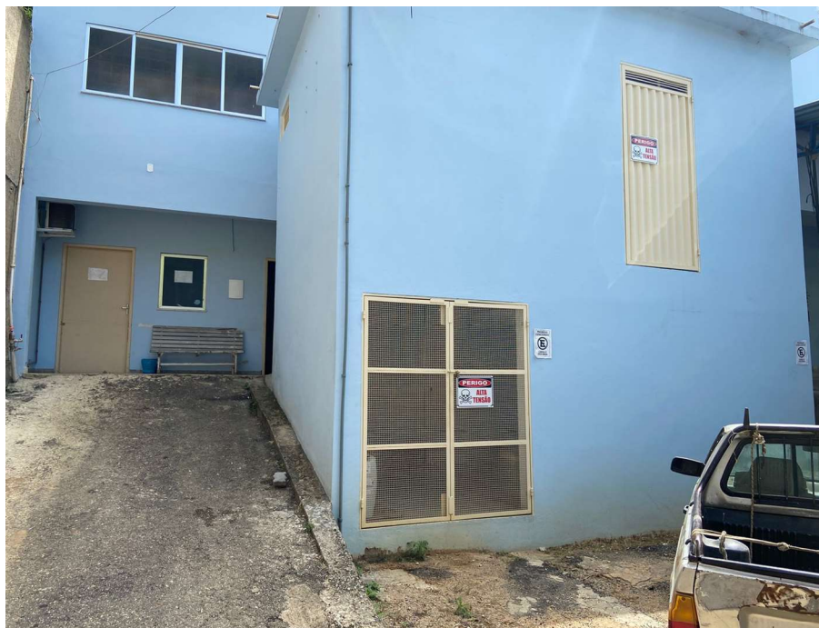
Figura 1: Entrada da unidade.