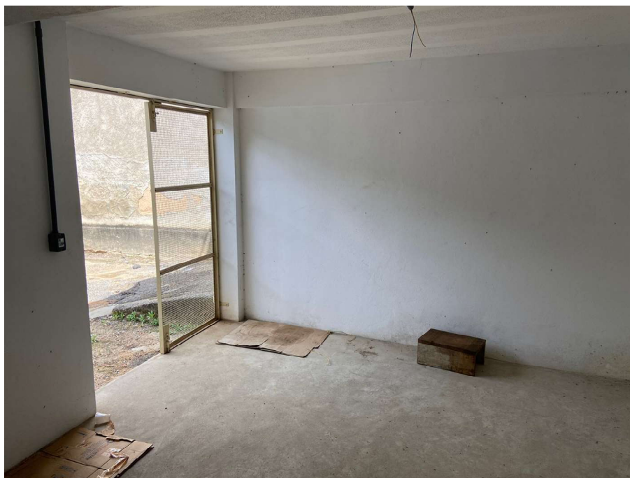
Figura 3: Vista da entrada para o quadro de distribuição.