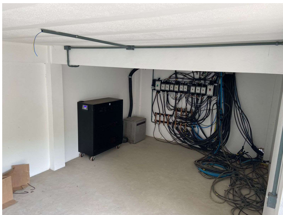
Figura 4: Vista da entrada para o quadro de distribuição.