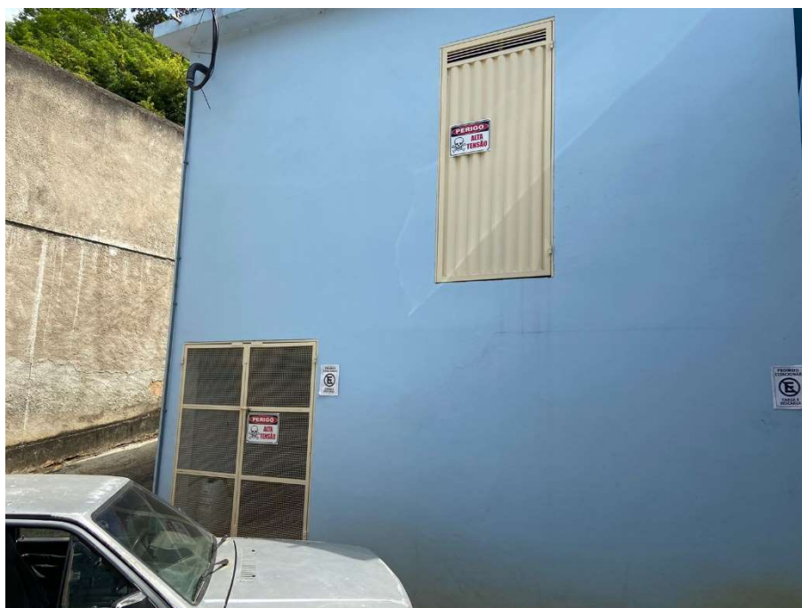
Figura 2: Vista de fora sala do grupo gerador.