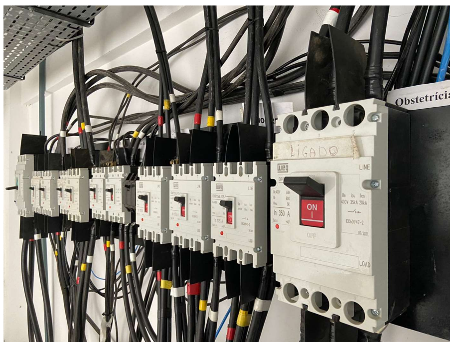
Figura 6: Detalhamento das ligações.